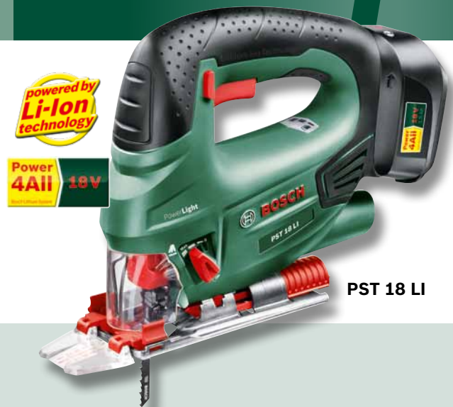
PST 18 LI