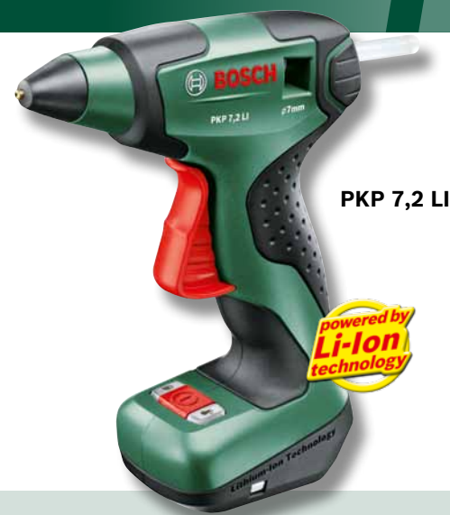
PKP 7,2 LI

Porzellanpuppen, Dampflok, alte Autos. Die Vorliebe für Sammlerstücke macht das Kleben alltäglich. Erst recht, wenn Kinder im Haus sind. Da gibt's immer was zu reparieren, montieren, fixieren oder zu basteln. Alles ganz einfach: mit den Bosch Klebepistolen! Die PKP 7,2 LI ist schon nach 15 Sekunden aufgeheizt und einsatzbereit, sie verbindet fast alle Materialien dauerhaft, auch auf Zug. Mit dem leichtgängigen Abzug gelangen Ihnen selbst feinste Klebebahnen – ideal, um z. B. Kabel zu verlegen oder Zierleisten anzubringen.