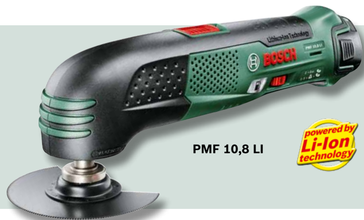
PMF 10,8 LI

und Laminat kürzen Sie den Türstock spielend. Sie wollen die Steckdose hinter dem Wohnzimmerschrank zugänglich machen? Ebenfalls kein Problem! Und auch vor Metall macht das Multifunktionswerkzeug PMF 10,8 LI nicht Halt. Mit den Metallsägeblättern trennen Sie Nägel und Rohre im Handumdrehen auf die gewünschte Länge.