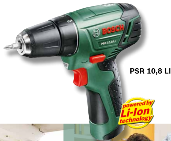
PSR 10,8 LI

Ein typischer Fall für Akku-1-Gang-Bohrschrauber von Bosch: Das Serienschrauben in Hartholzprofilbretter bei der Bodenmontage im Außenbereich. Klein und leicht, aber mit viel Kraft und Ausdauer bewältigt der Akku-Bohrschrauber auch umfangreiche Arbeiten schnell und präzise.