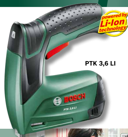
PTK 3,6 LI

Verabschieden Sie sich von Hammer, Schrauben, Klebstoff und Reißzwecken: Der handliche Akku-Tacker von Bosch hilft Ihnen schnell und bequem beim Befestigen von unterschiedlichen Materialien wie Stoffen, Karton, Pappen auf Oberflächen aus weichem Holz.